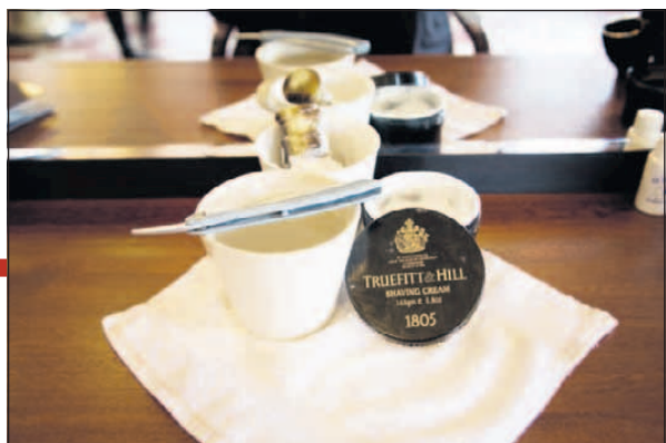
Salonen emmer af gode gamle dage – også produkterne, som er fra 200 år gamle Truefitt & Hill.